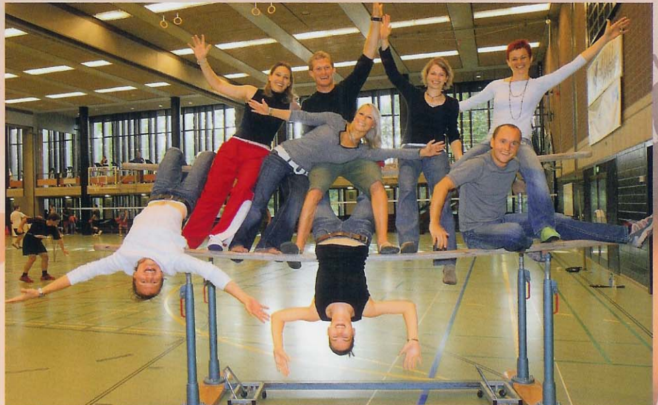
Die glücklichen acht, die zusammen mit den Stars am Super10Kampf 2006 teilnehmen.